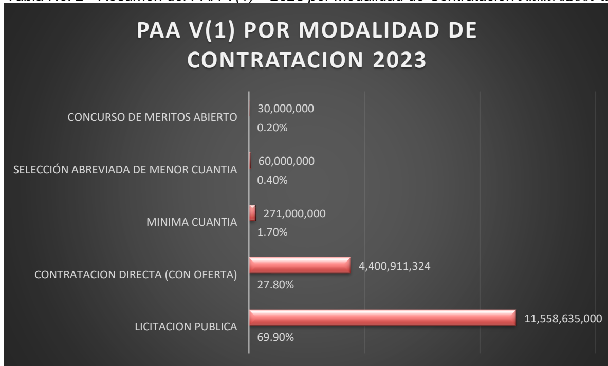
Grafica No. 1

La anterior gráfica, nos muestra los valores porcentuales y totales a ejecutar en cada una de las modalidades de contratación; destacando lo proyectado en la modalidad de Licitación Pública con un total de $11.558.635.000, ocupando un 69.9% del total proyectado, de igual forma destacando la modalidad de Contratación Directa (Con Oferta), con un total de $4.400.911.324, alcanzando un 27.8%. finalmente, se observa que las demás modalidades se mantienen dentro de un rango del 0.2% al 1.7%.