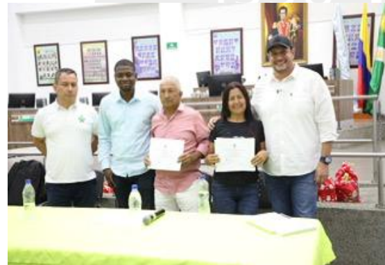
Entrega de certificados y reconocimientos por parte de IMVIYUMBO y el SENA, a estudiantes del municipio de Yumbo