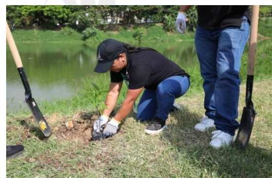
Jornadas de poda y limpieza de parques