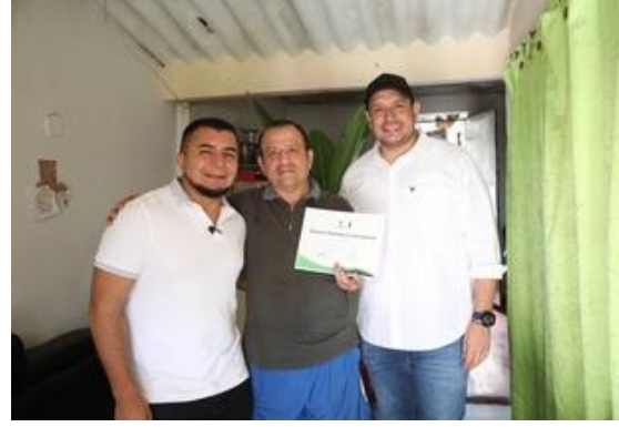
Entrega de títulos de propiedad