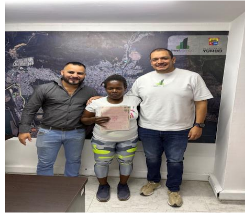
Entrega de subsidio de reubicación definitiva