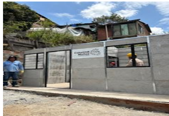
Convenio Fundación Catalina Muñoz - Mejoramientos de vivienda